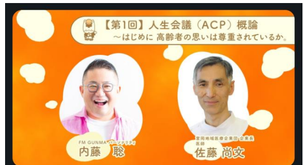
【湯けむりフォーラム特別企画】人生会議(ACP)概論 (第1回) | 健康長寿社会づくり推進課 | 群馬県

人生会議について詳しく知りたい方は群馬県動画情報配信サイト『ツルノス』を視聴してください。(全8回あります。)